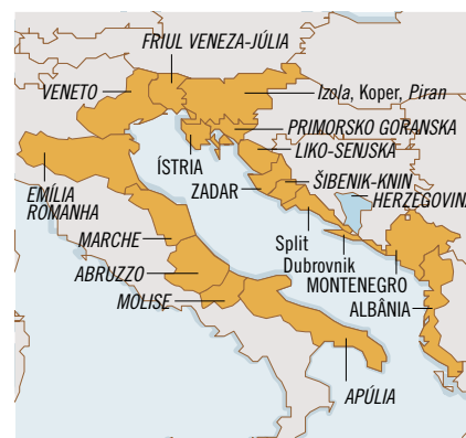
Euro-região do Adriático.