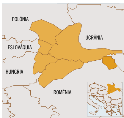
Euro-região dos Cárpatos.